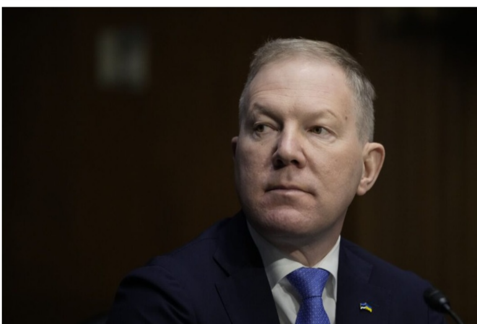
Reformierakondlasest riigikogu liige ja väliskomisjoni esimees Marko Mihkelson.

Reformierakondlasest riigikogu liige ja väliskomisjoni esimees Marko Mihkelson tegi Postimehe andmetel ühest lapsest kohatuid pilte, millel laps oli kas alasti või naps riietuses. Ühel pildil olevat näha olnud vaid lapse katmata intiimpiirkond. Kuigi hageja meelest olevat alaealist kujutatud seksuaalseerivalt ja erootiliselt, ei algatatud Mihkelsoni vastu kriminaalmenetlust. Samas leiti, et selliste piltide tegemine on eetilisel taunitav.